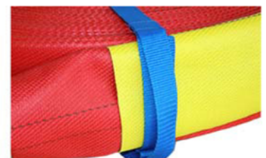
Courroie de portage

Certifié ISO 9001 : 2008 Quality Management System